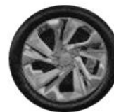
ЛЕГКОСПЛАВНЫЕ КОЛЁСНЫЕ ДИСКИ 255/45 R20 «СДВОЕННЫЕ СПИЦЫ»