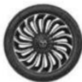
ЛЕГКОСПЛАВНЫЕ КОЛЁСНЫЕ ДИСКИ 255/45 R20 «TURBINE»