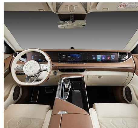
СЛОНОВАЯ КОСТЬ С КОРИЧНЕВЫМИ ЭЛЕМЕНТАМИ 1