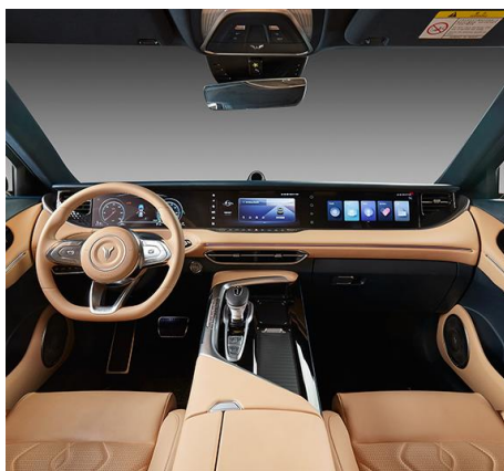
БЕЖЕВЫЙ С ЭЛЕМЕНТАМИ ТЁМНО-СИНЕГО ЦВЕТА