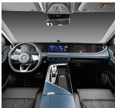
ЧЁРНЫЙ С ЭЛЕМЕНТАМИ ТЁМНО-СИНЕГО ЦВЕТА